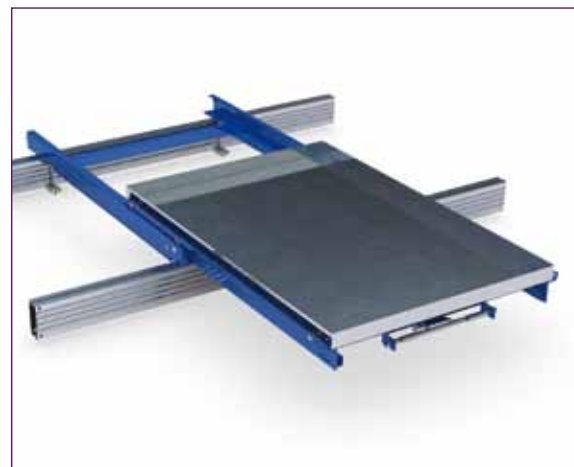
Bilden visar Balkmodell 600 med tillbehöret plåtlåda för pallkrage.